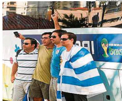
Por uma boa experiência. Turistas na Barra durante a Copa de 2014: setor hoteleiro quer manter bandidos longe dos visitantes